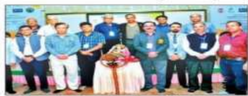
एराएन में आयोजित कार्यशाला के दौरान विद्वानों।

30-40 साल के 25 फीसदी युवाओं के घुटने-हड्डियों में दर्द, पैरों में सूजन