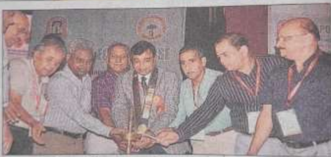
मेडिकल में रविवार को दीप जलाकर कार्यशाला का शुभारंभ किया गया। • हिन्दुस्तान