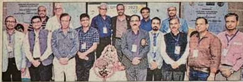
आगरा आर्थोपेडिक सोसायटी और एसएनएमसी की 'नी अपडेट-2023' कार्यशाला रविवार को हुई।