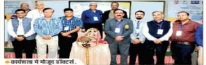
कार्यशाला में मौजूद डॉक्टरों।